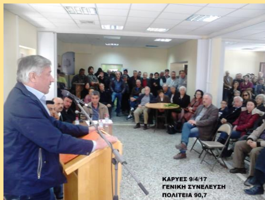
ΚΑΡΥΕΣ 9/4/17 ΓΕΝΙΚΗ ΣΥΝΕΛΕΥΣΗ ΠΟΛΙΤΕΙΑ 90,7