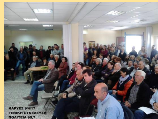
ΚΑΡΥΕΣ 9/4/17 ΓΕΝΙΚΗ ΣΥΝΕΛΕΥΣΗ ΠΟΛΙΤΕΙΑ 90,7